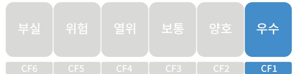
[현금 흐름 등급]

- 2018년 신용평가사 신용 평가에 따라, 믿을 수 있는 'AA등급' 기업으로 분류되어 상거래를 위한 신용능력이 우량하며, 환경변화에 적절한 대처가 가능한 기업으로 평가되었습니다.